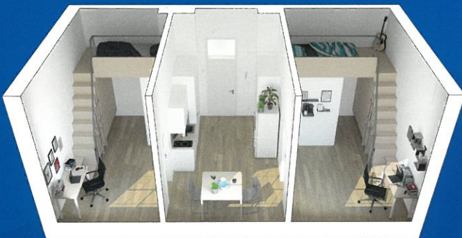
2-Zimmer-Wohngemeinschaft mit ca. 11 – 19 m 2 großen Zimmern

In jedem Fall haben wir das Richtige für Dich!