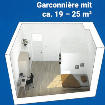
Garçonnière mit ca. 19 – 25 m 2