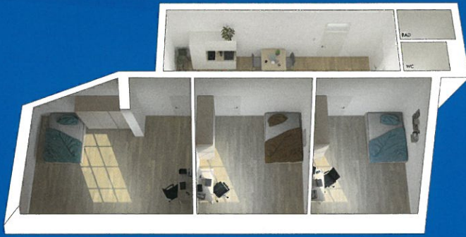
3-Zimmer-Wohngemeinschaft mit ca. 10 – 19 m 2 großen Zimmern