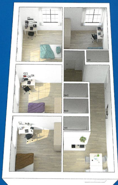
4-Zimmer-Wohngemeinschaft mit ca. 15 - 19 m 2 großen Zimmern