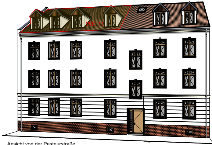
Ansicht von der Pasteurstraße