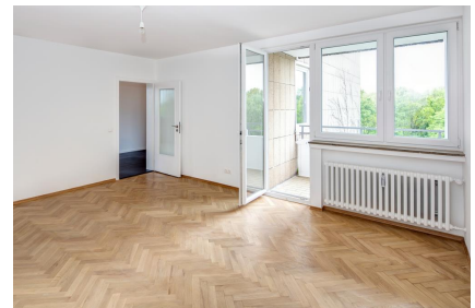
Wohnzimmer - Beispielbild