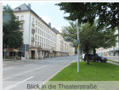
Blick in die Theaterstraße