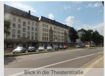
Blick in die Theaterstraße