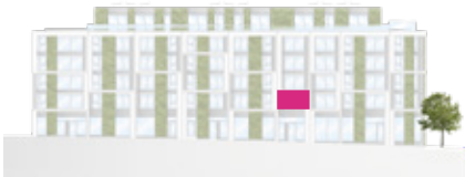
Haus A – Ansicht Süd