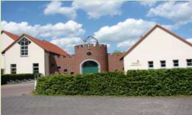
„ KITA Zwergenburg,“