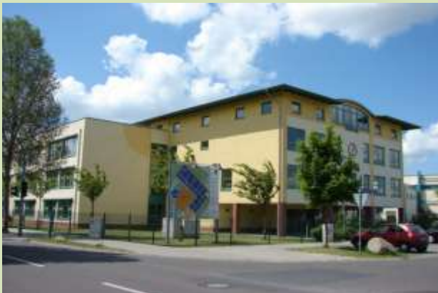
„ Neue Zeebr@-Grundschule „