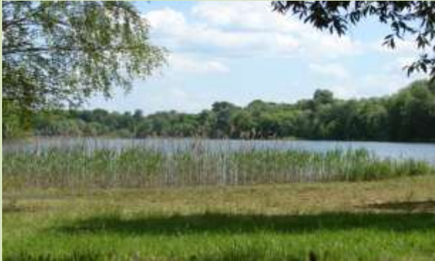
„ Der Nymphensee“