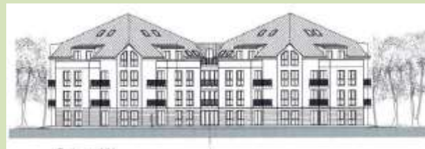
Vertrieb von 48 Seniorenwohnungen 41– 68 m 2