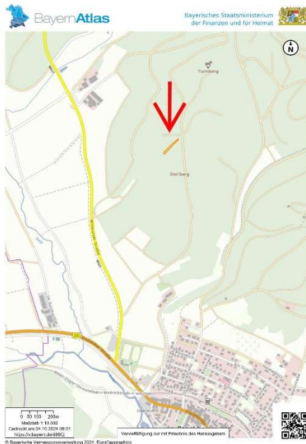
Umgebungskarte: © Bayerische Vermessungsverwaltung