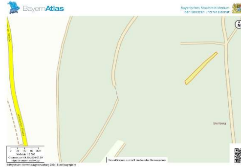
Lageplan: © Bayerische Vermessungsverwaltung