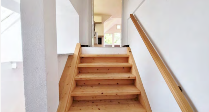
AUFGANG IM TREPPENHAUS