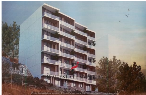
20230628_160350 - Copy.jpg