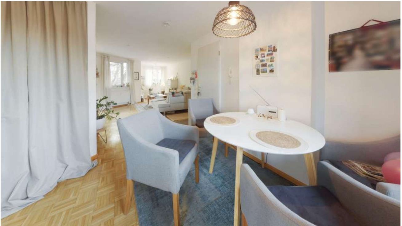
Wohnung Nr. 3