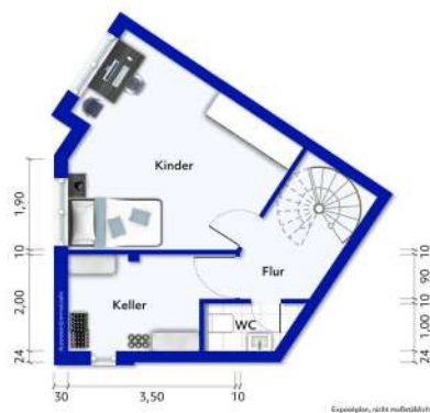
Wohnung Nr. 1