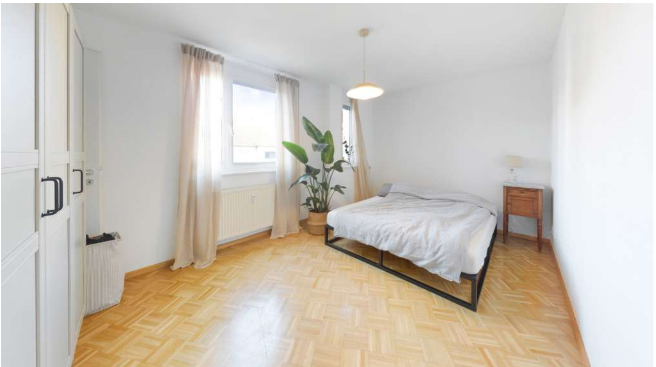
Wohnung Nr. 4