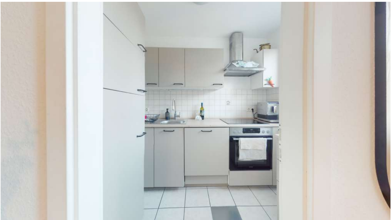
Wohnung Nr. 4