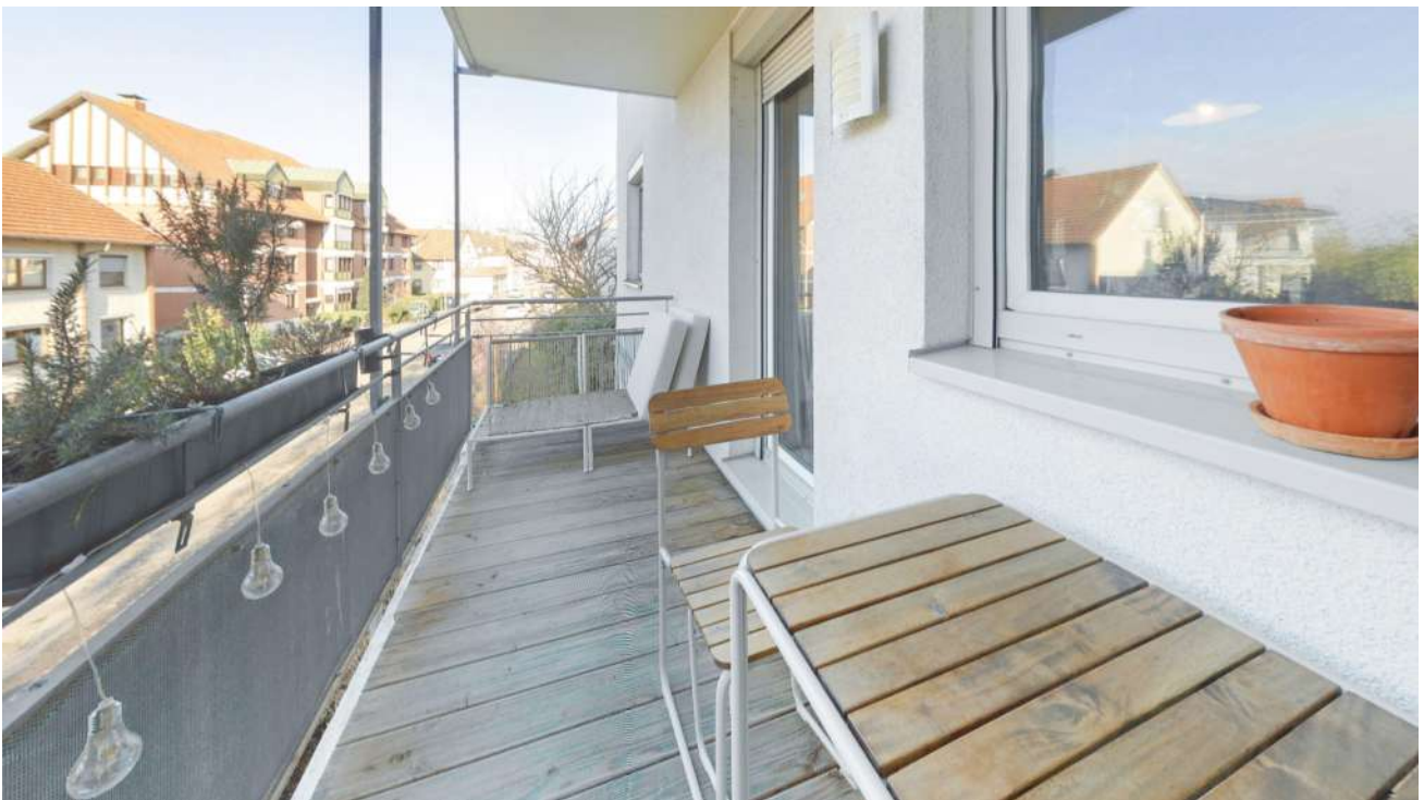
Wohnung Nr. 4