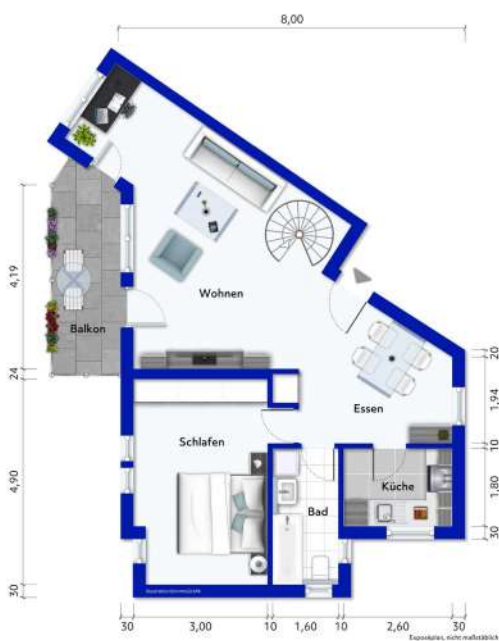
Wohnung Nr. 1