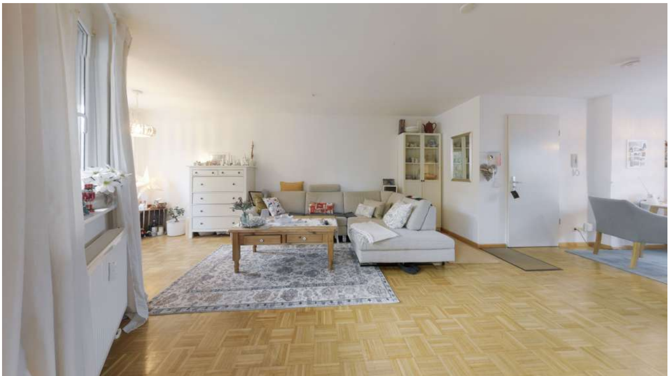
Wohnung Nr. 3