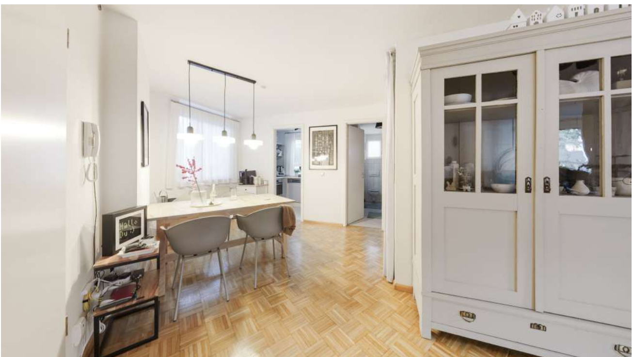
Wohnung Nr. 1