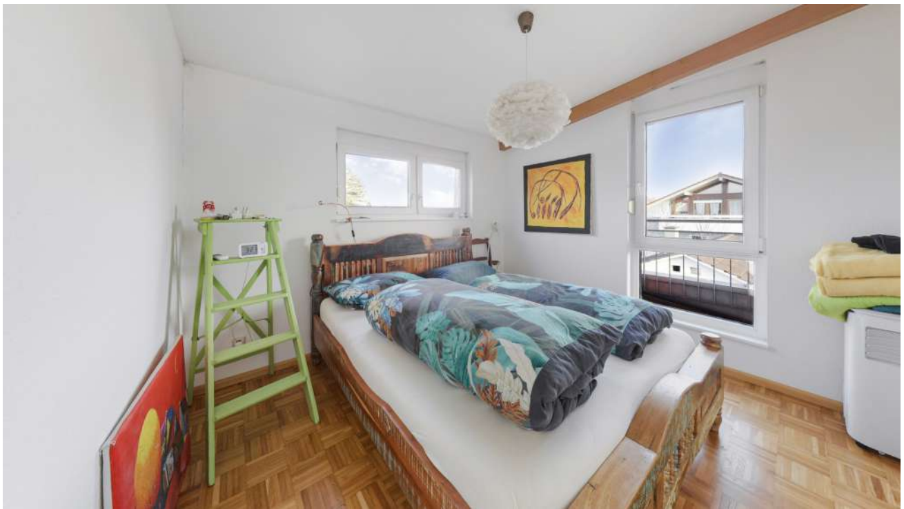
Wohnung Nr. 5