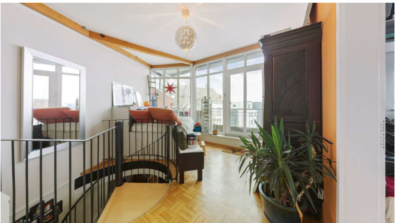
Wohnung Nr. 6