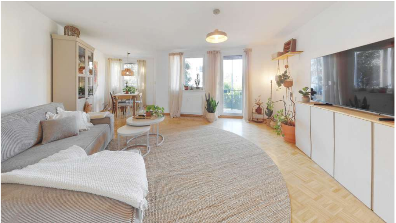
Wohnung Nr. 4