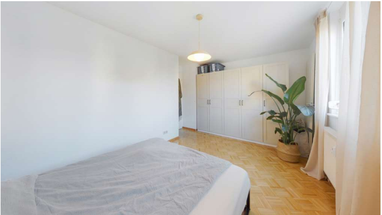
Wohnung Nr. 4