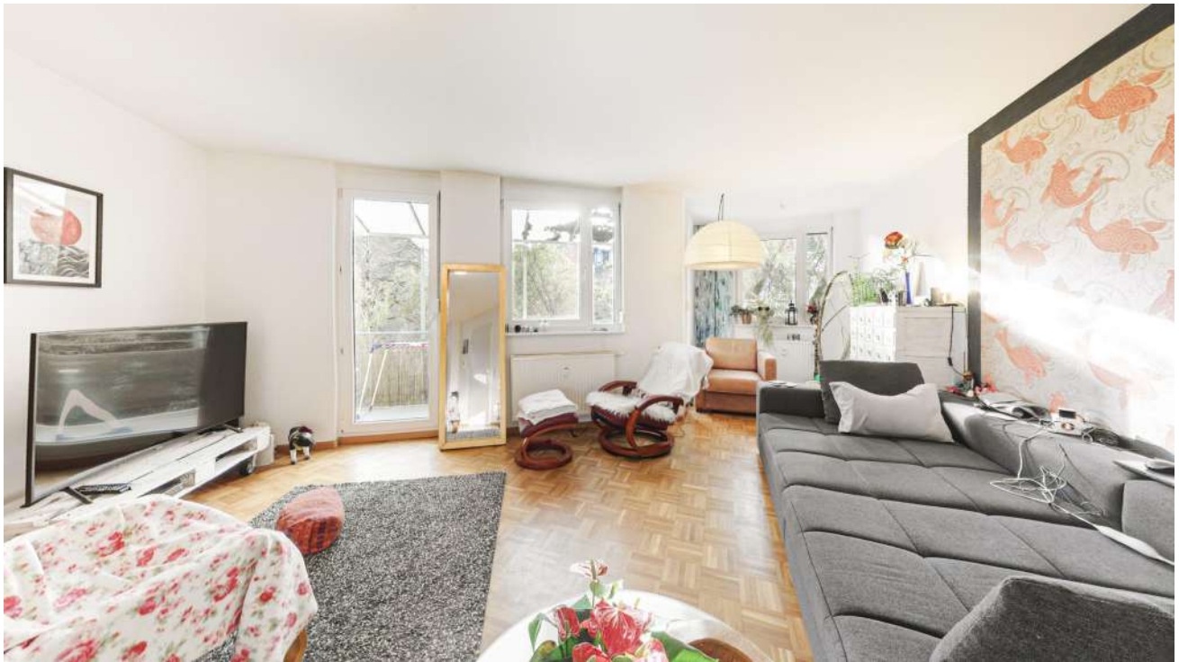
Wohnung Nr. 5