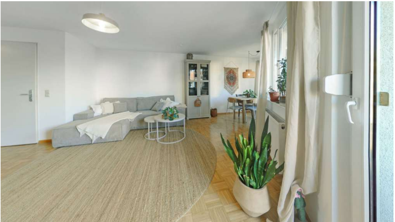
Wohnung Nr. 4