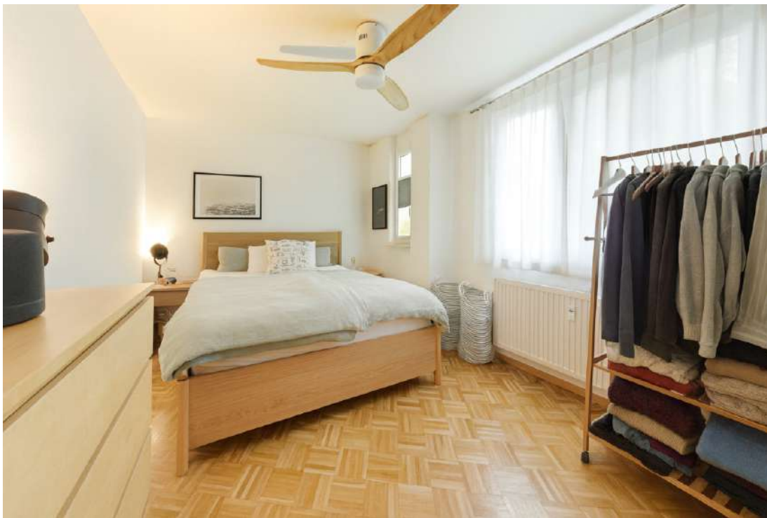
Wohnung Nr. 1