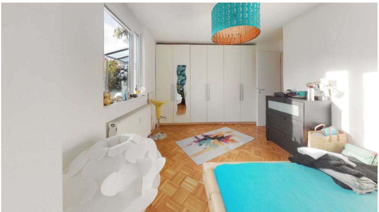
Wohnung Nr. 5