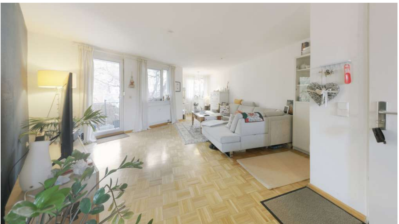
Wohnung Nr. 3