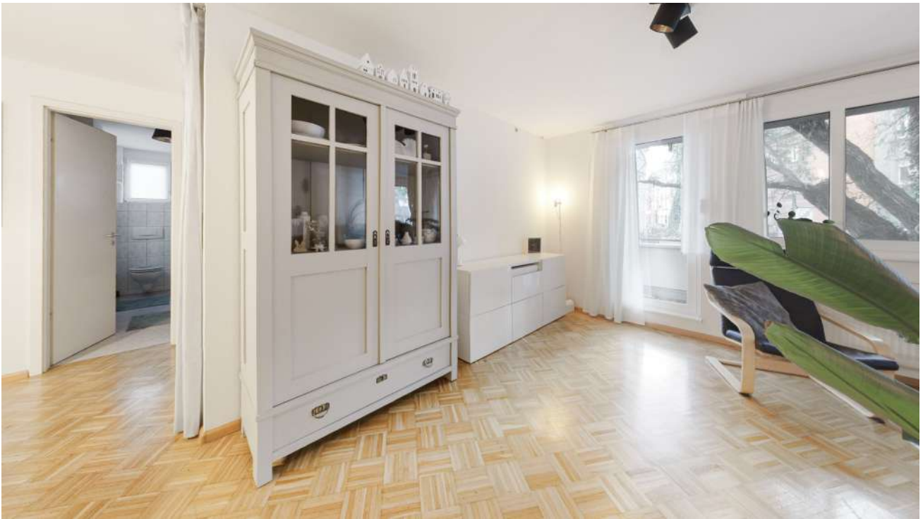
Wohnung Nr. 1