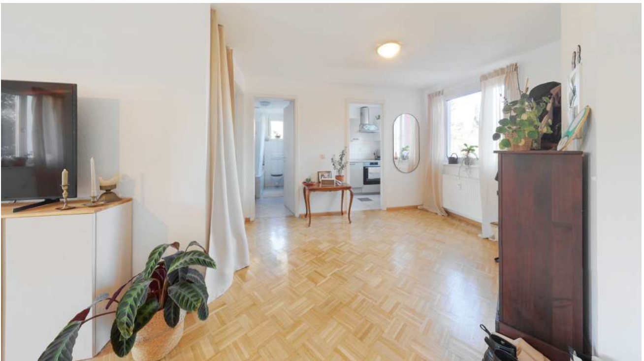
Wohnung Nr. 4