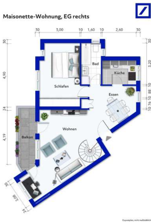
Wohnung Nr. 2