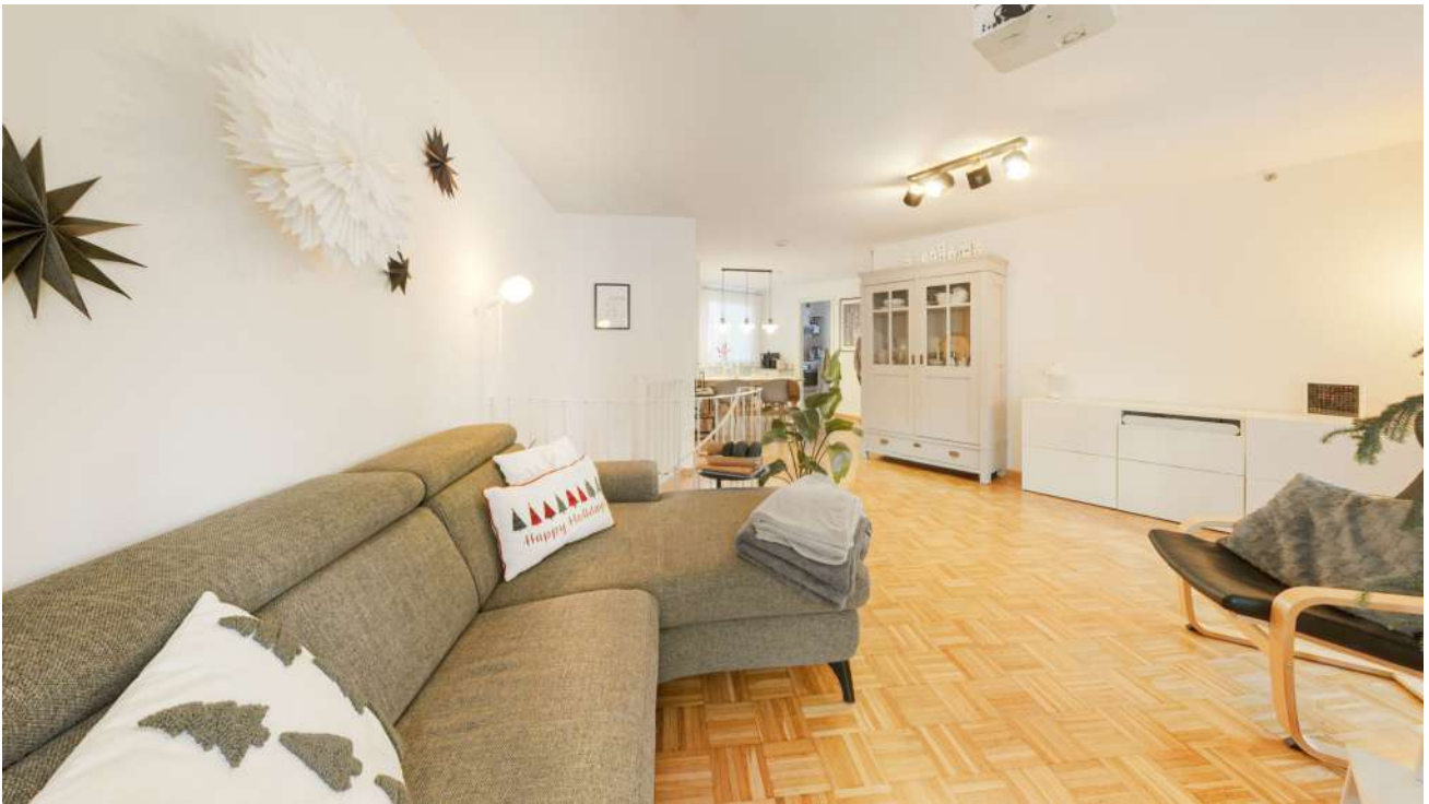
Wohnung Nr. 1