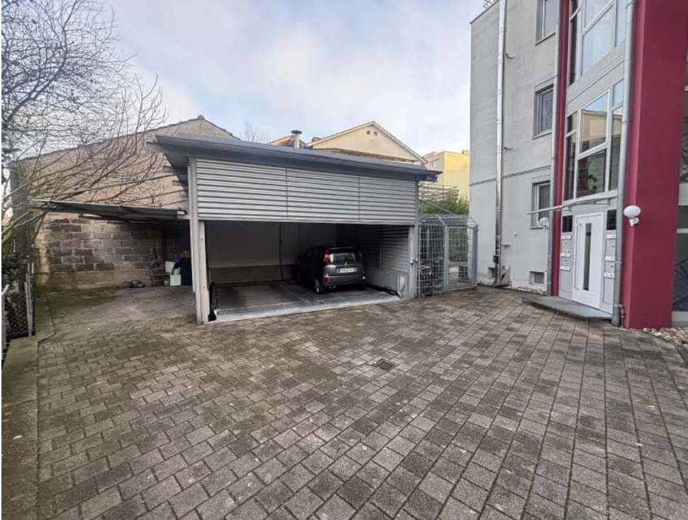
Parklift + Aussenstellplatz