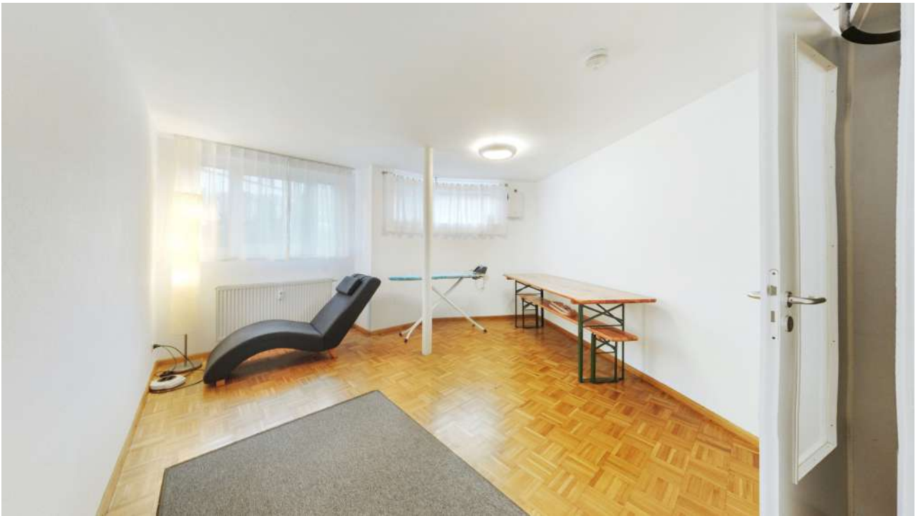
Wohnung Nr. 2