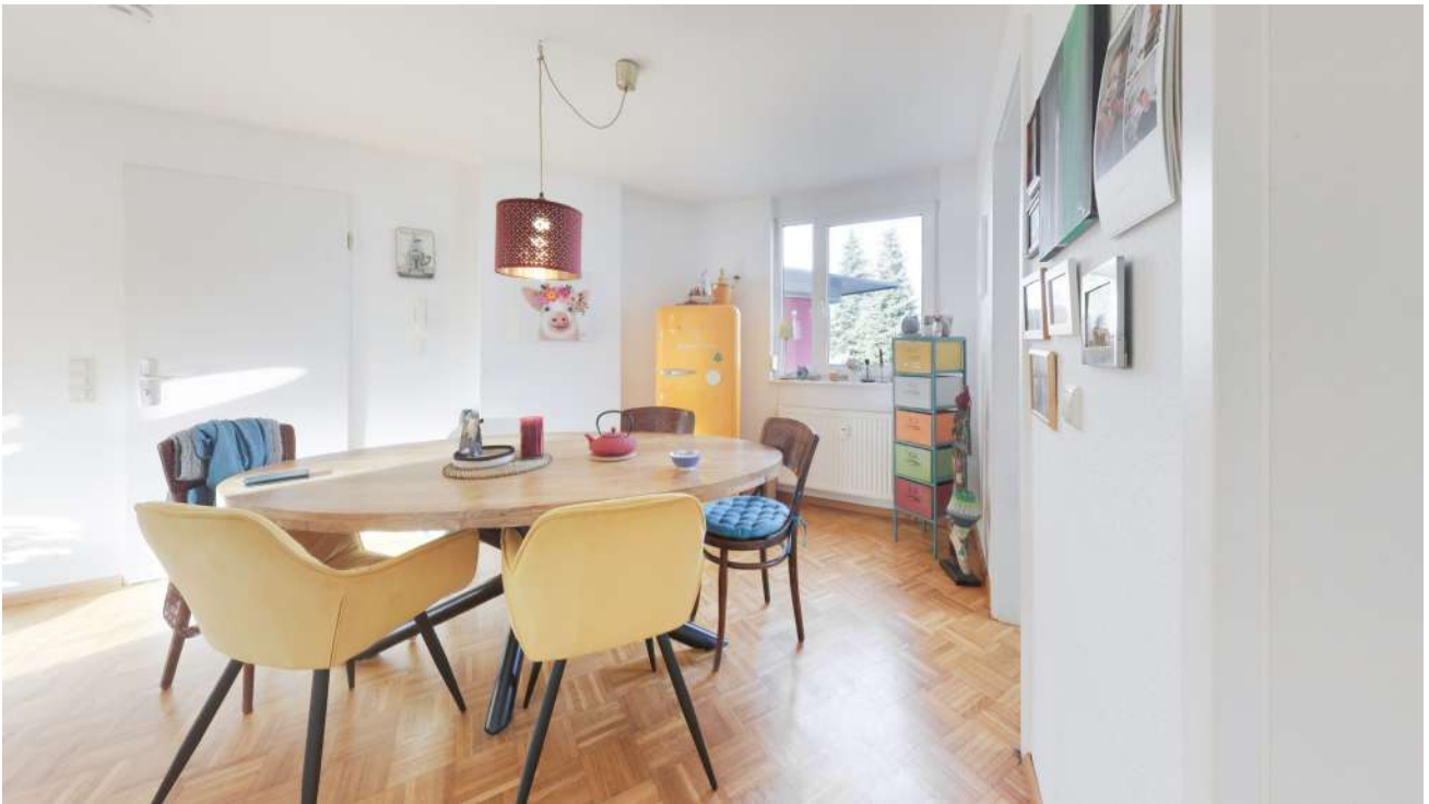
Wohnung Nr. 5