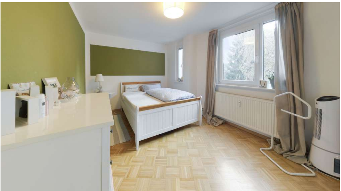
Wohnung Nr. 3