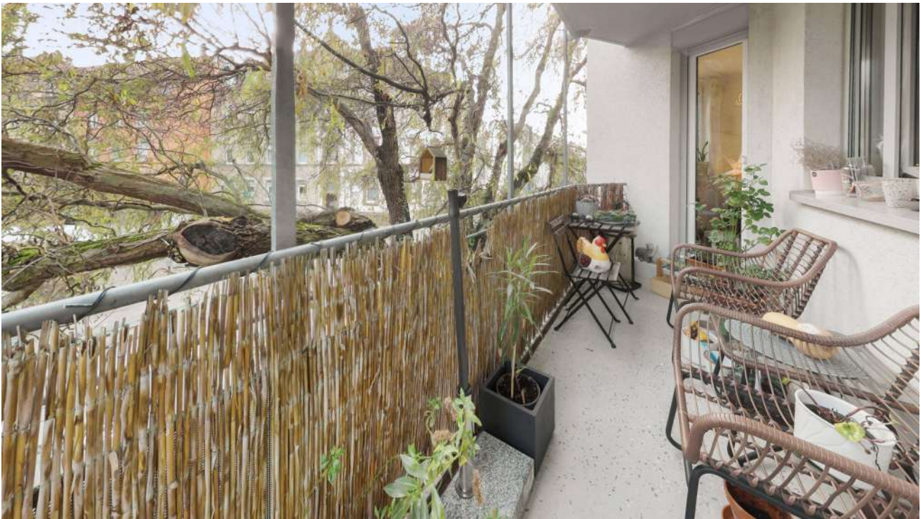
Wohnung Nr. 3