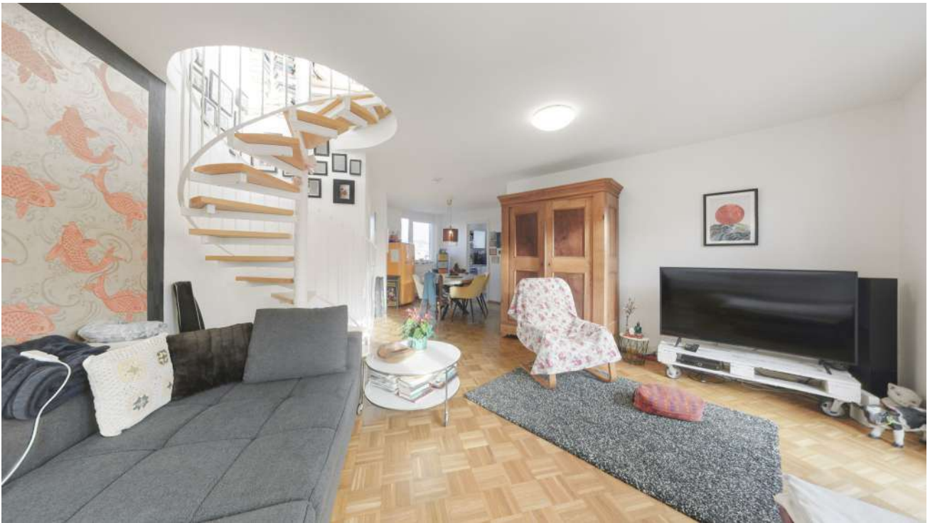
Wohnung Nr. 5