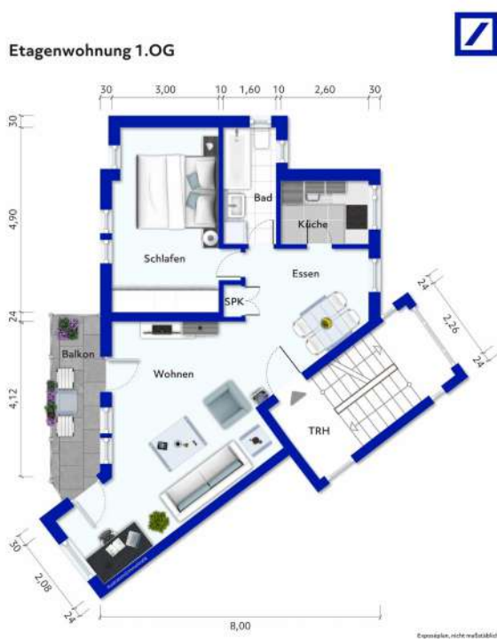
Wohnung Nr. 4