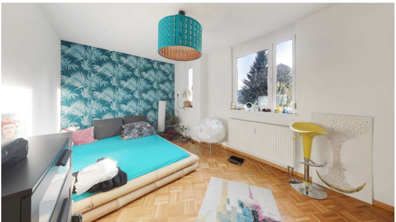
Wohnung Nr. 5