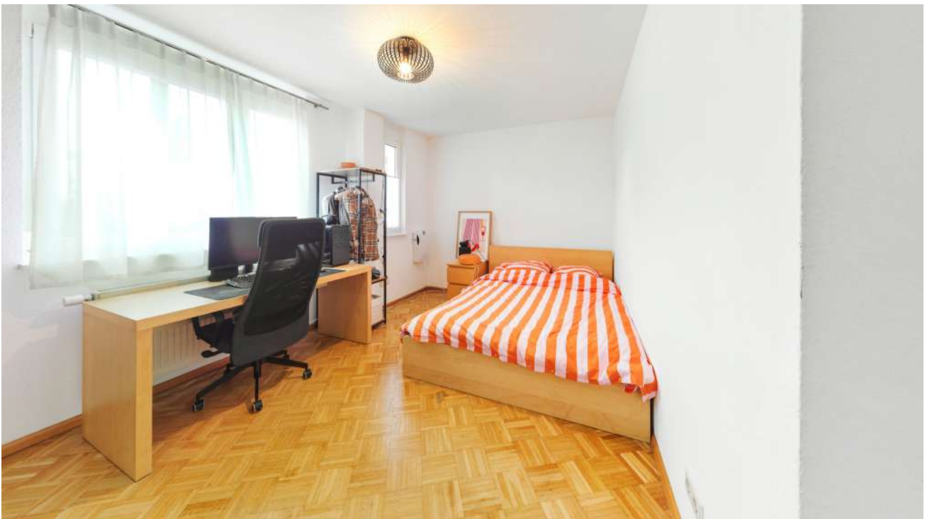
Wohnung Nr. 2