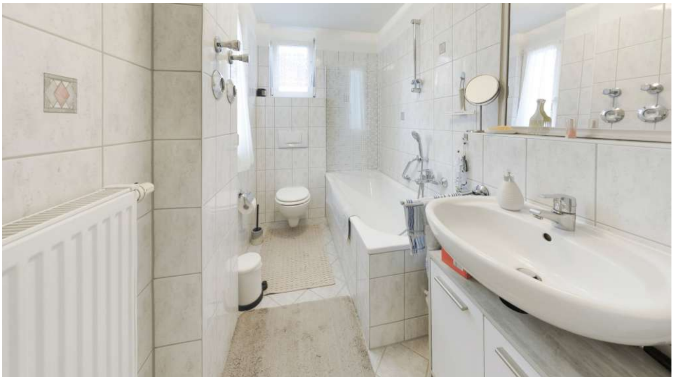
Wohnung Nr. 3