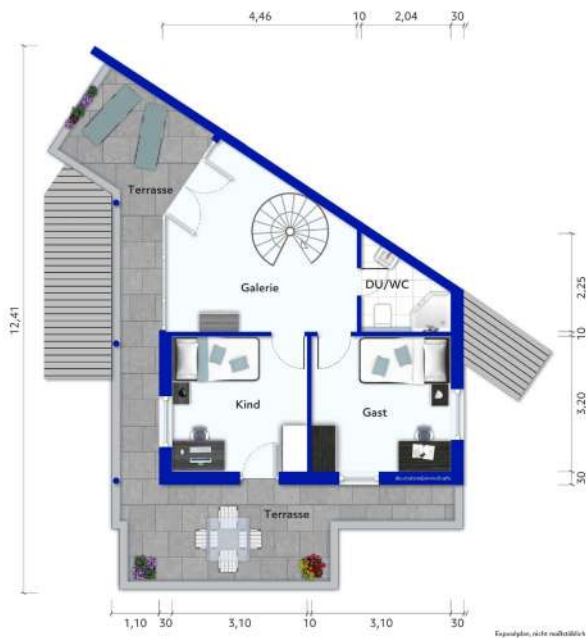
Wohnung Nr. 5