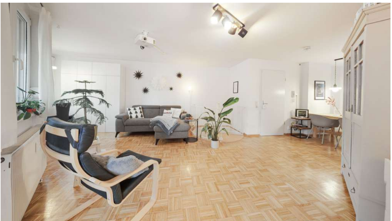
Wohnung Nr. 1