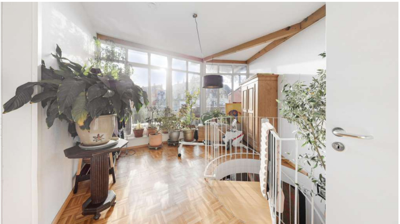
Wohnung Nr. 5