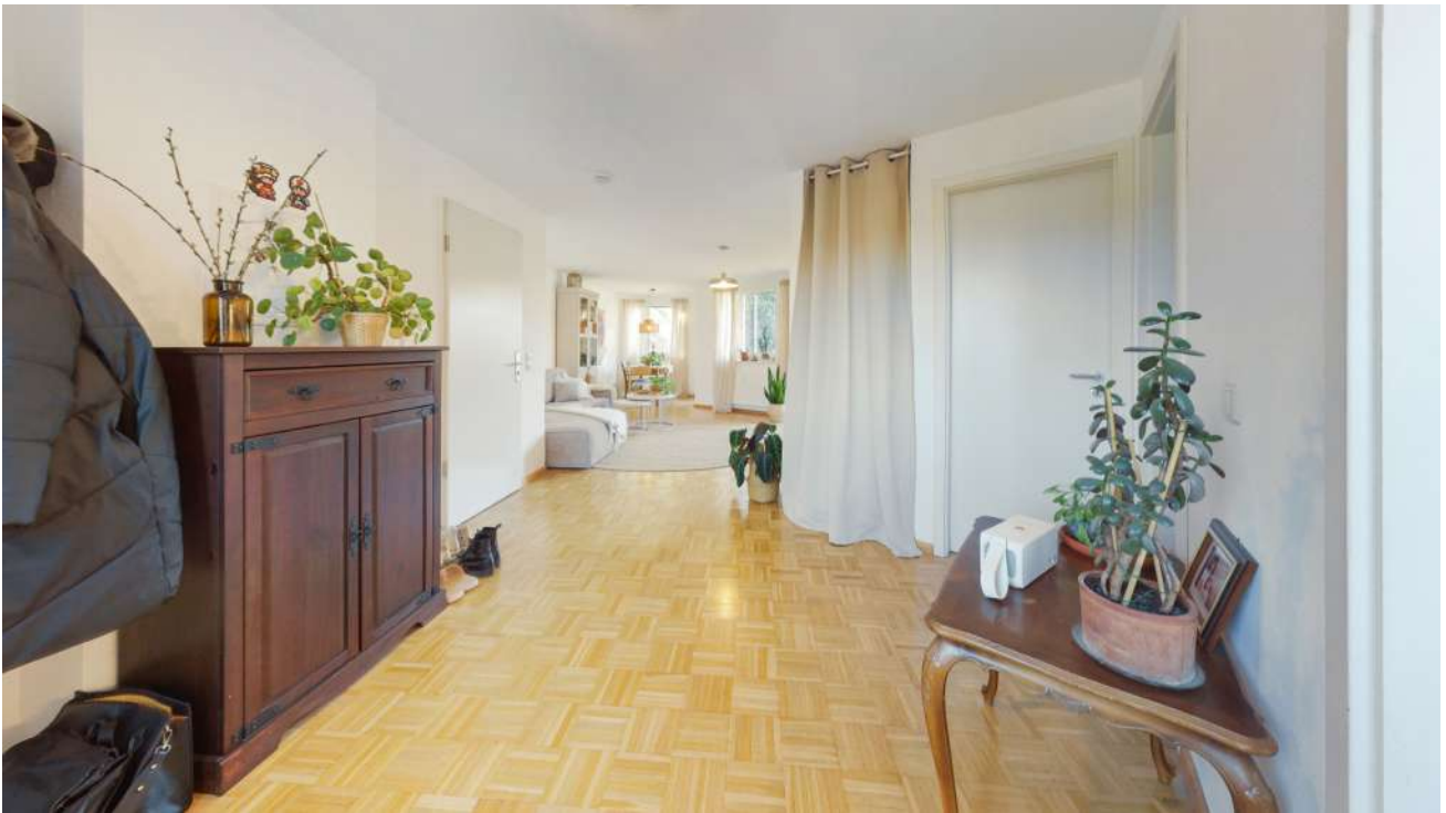
Wohnung Nr. 4