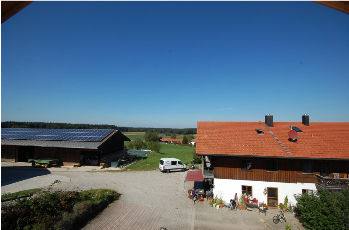
Ausblick in den Innenhof