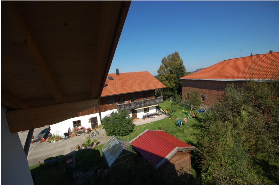
Ausblick in den Hof