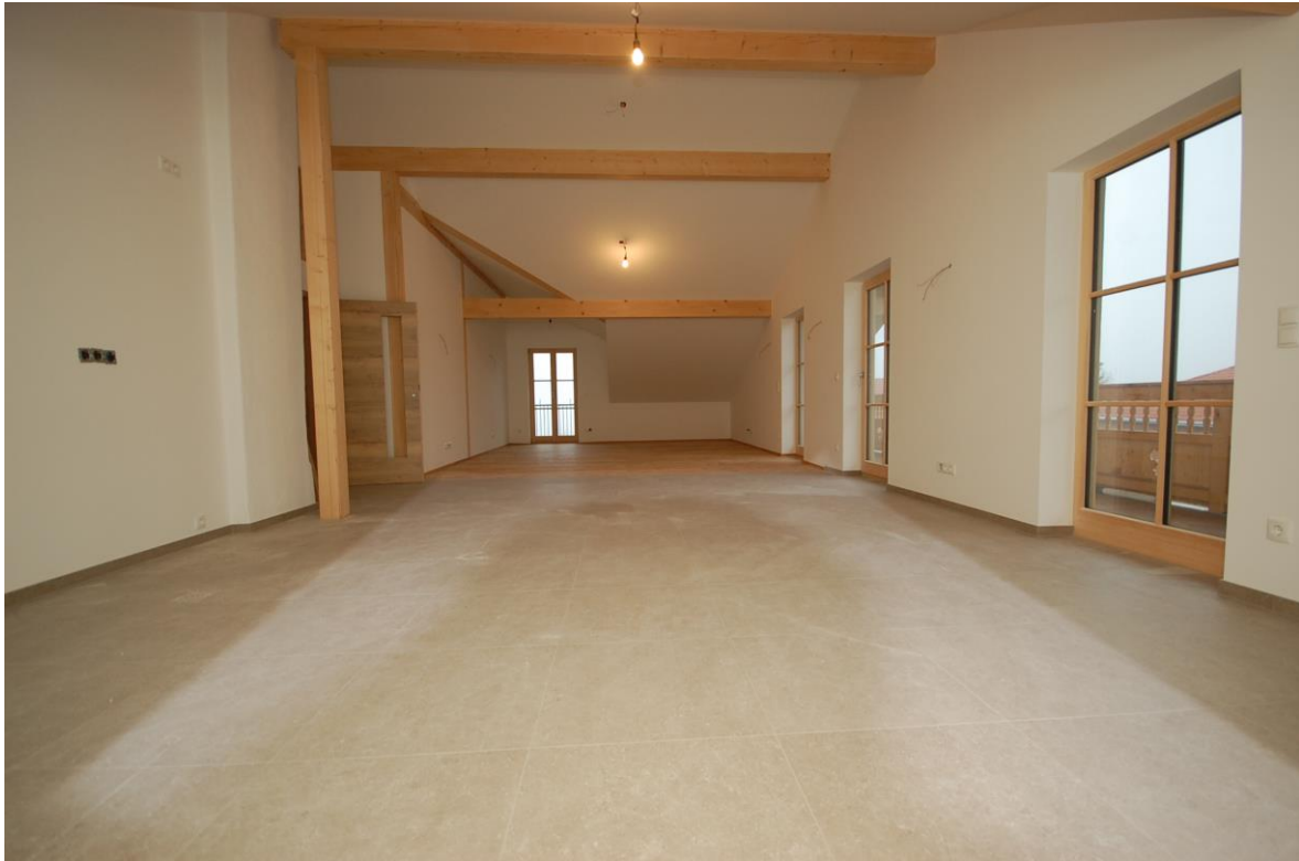
Wohnzimmer mit Küche Bild 2