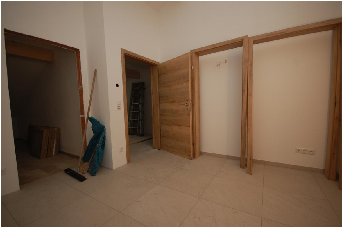
großer Vorflur Bild 1