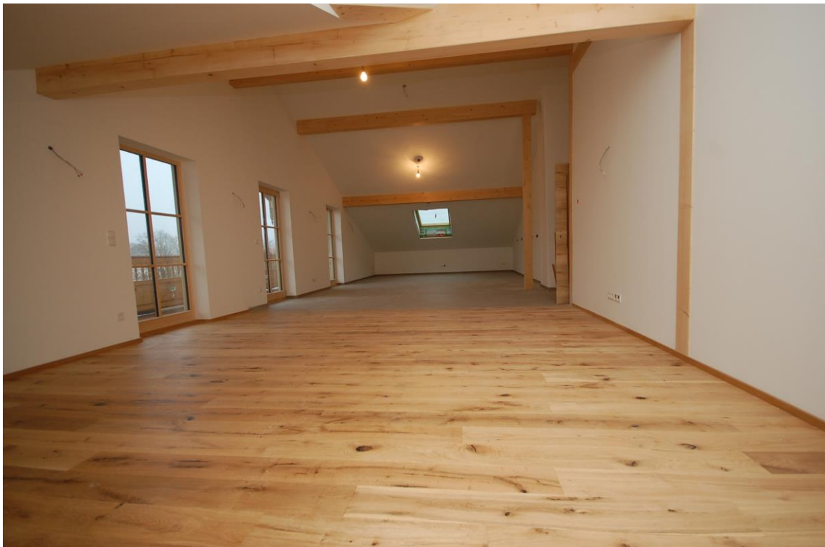
Wohnzimmer mit Küche Bild 1