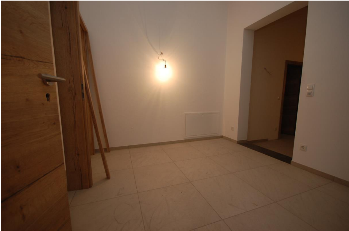
großer Vorflur Bild 2