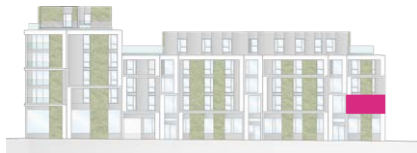
Haus B - Ansicht Ost