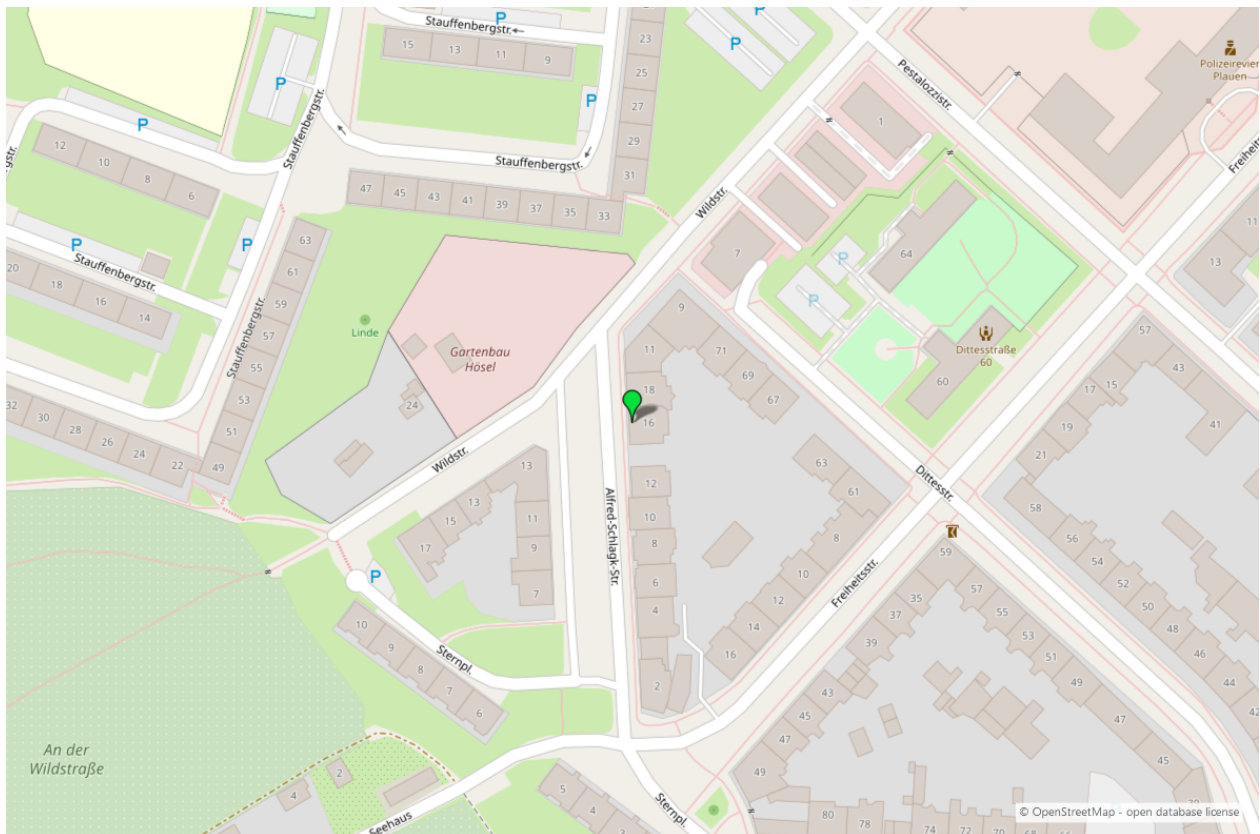
Umgebungskarte für „Alfred-Schlag-Straße 16 in 08523 Plauen“