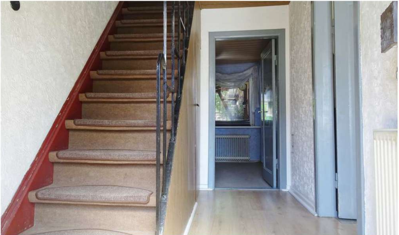
Vorderer Eingangsbereich. Ansicht, bei betreten der Immobilie durch die Haustür.