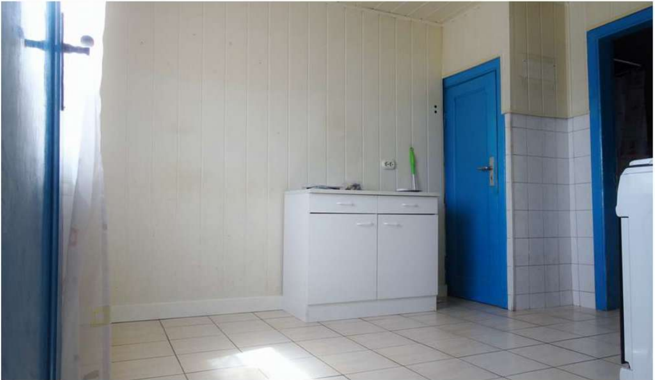
In der Ecke befindet sich ein kleiner Abstellraum.