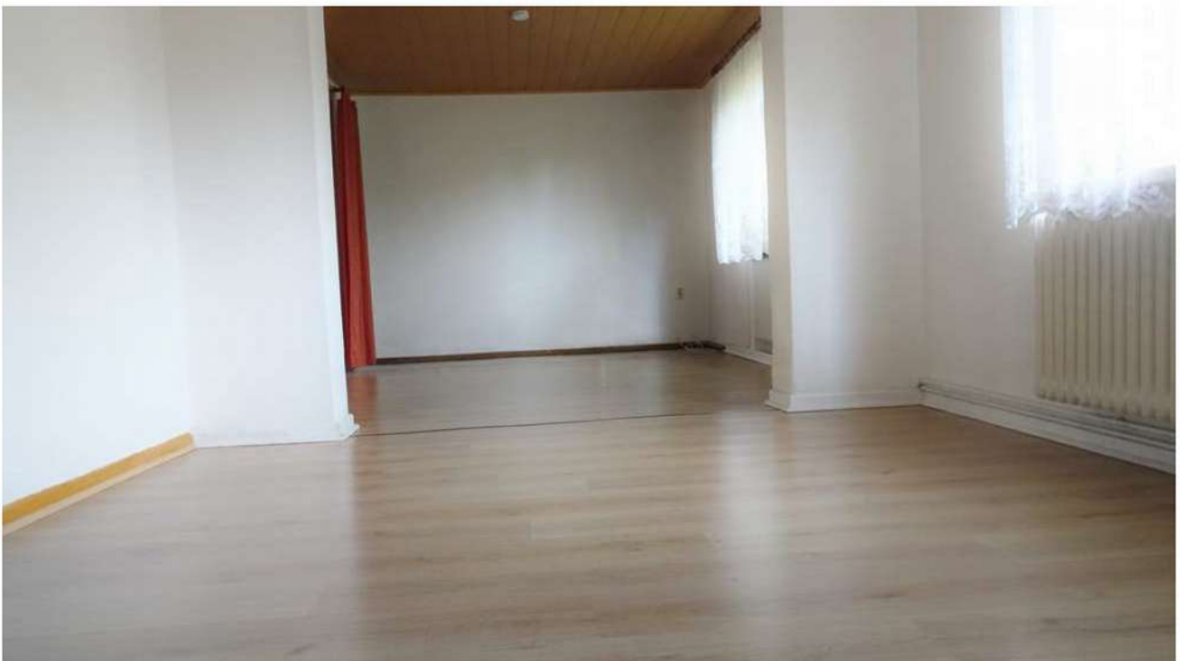
Durch die Tür rechts vom Eingangsbereich betritt man das Wohnzimmer. An das Wohnzimmer grenzen zwei Räume (vorne links und hinten links) an.