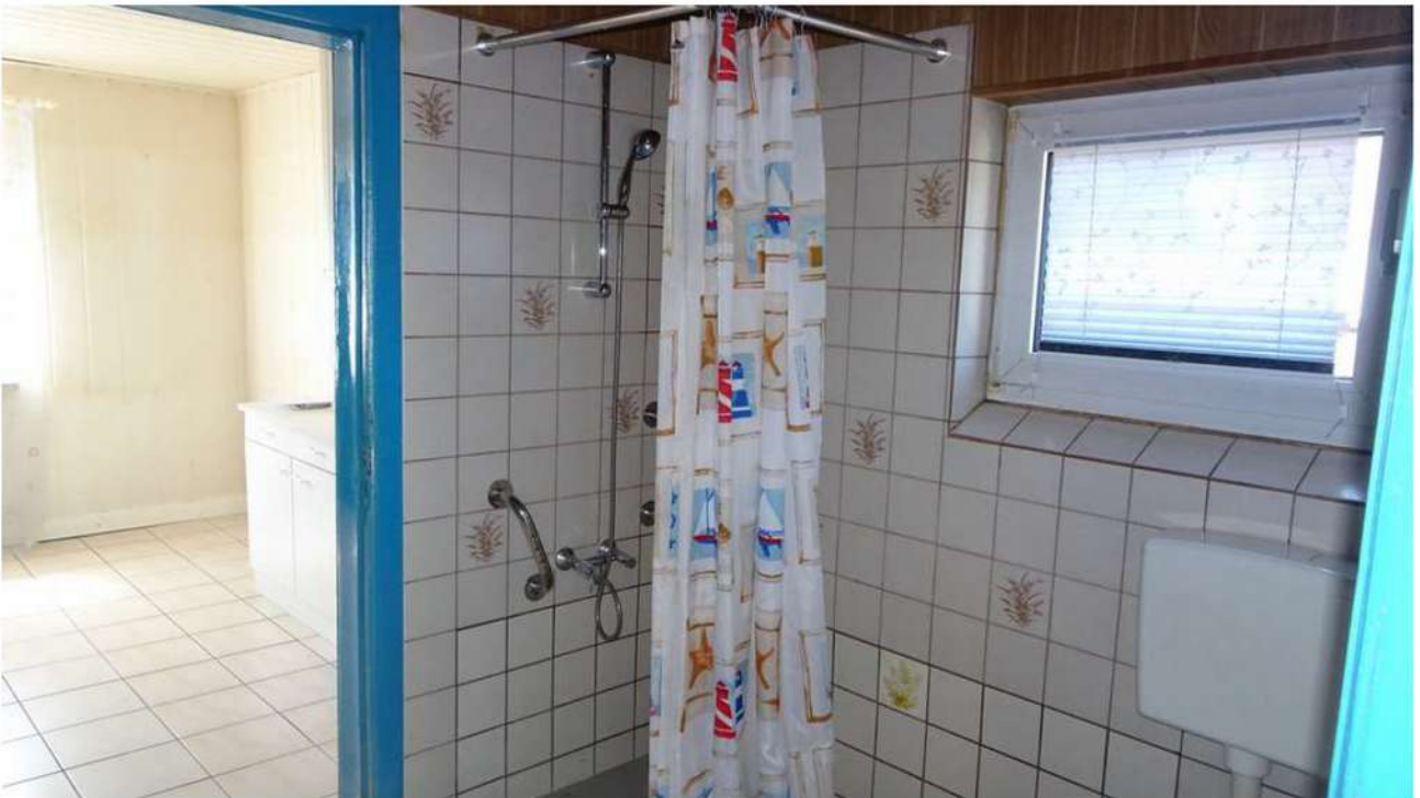
Von der Küche aus gelangt man ins Bad.