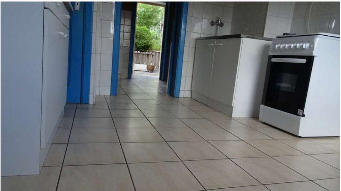
Der Boden wurde ca. 2005 barrierefrei bis zum hinteren Ausgang gefliest.