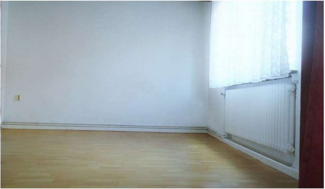
Dieses Zimmer befindet sich hinten links.