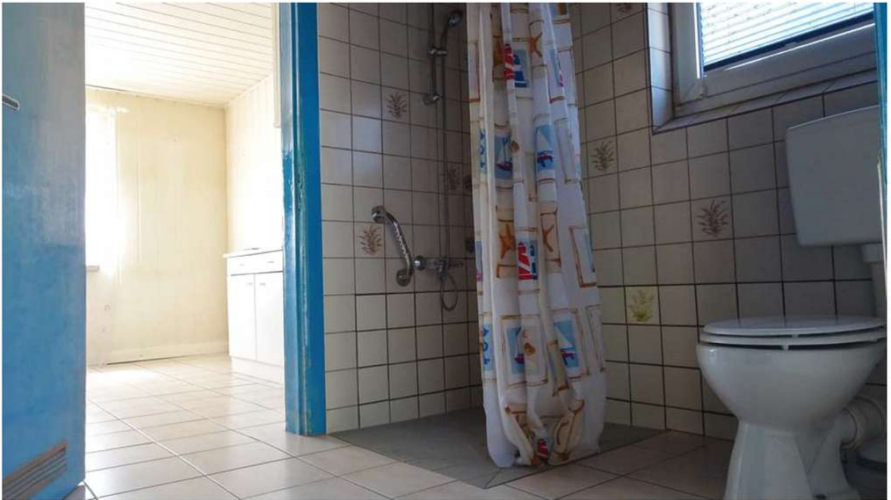
Das Bad hat Tageslicht und eine bodenebene Dusche. Neben dem Bad befindet sich noch zusätzlich ein Gäste-WC.