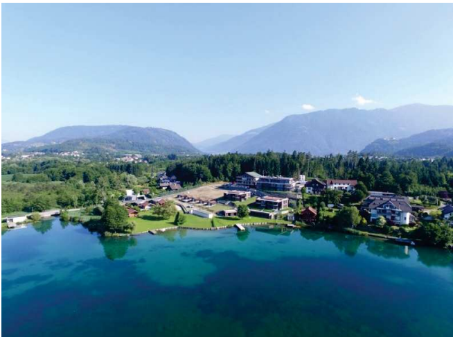
Lage am See