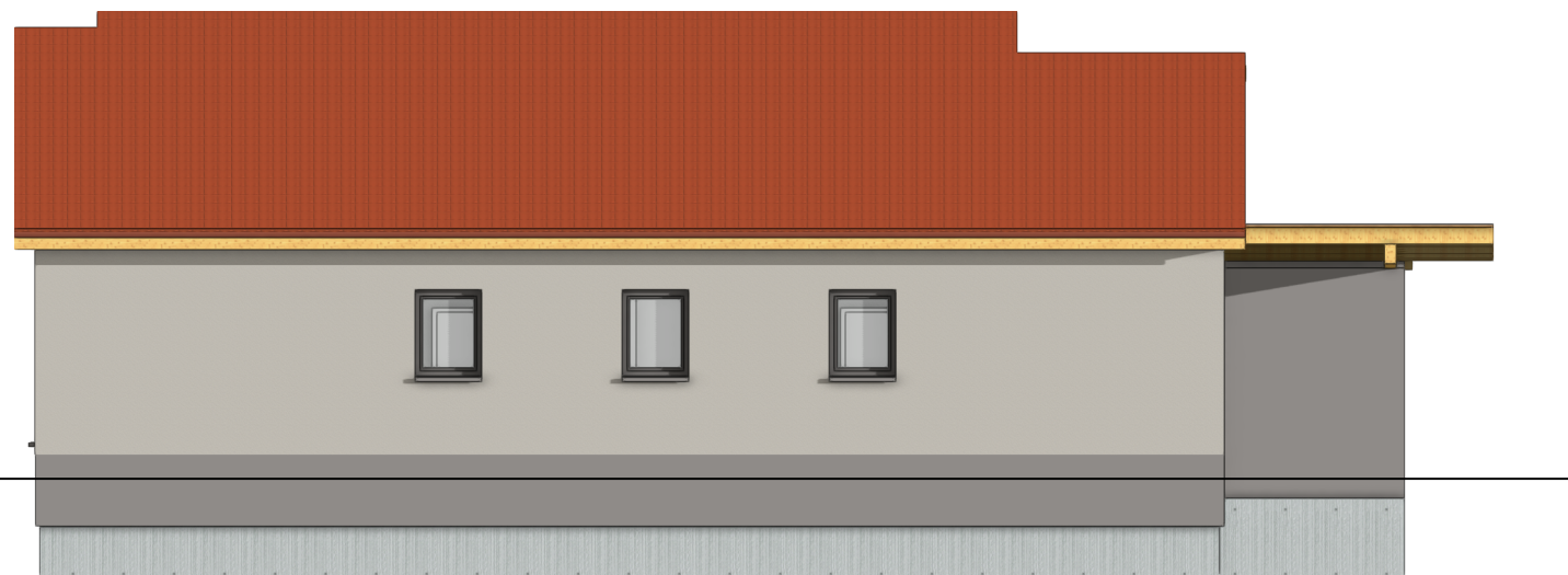
3.2 Ansicht Norden 1:100

PROJEKT Neubau eines Einfamilienhauses mit Carport und Abstellraum