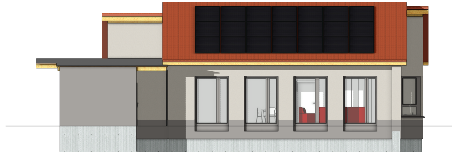
3.4 Ansicht Süden 1:100