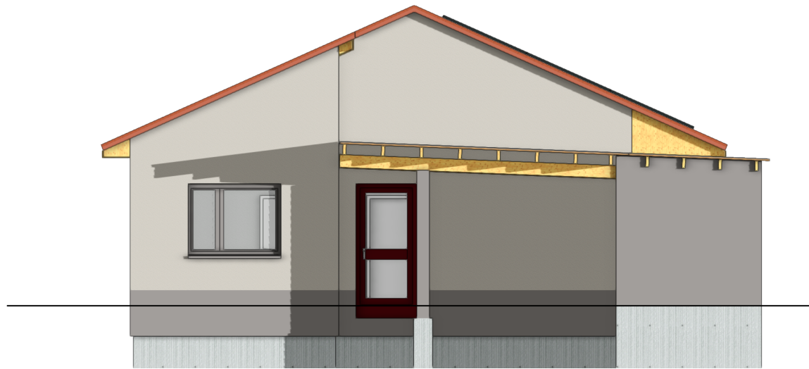
3.1 Ansicht Westen 1:100