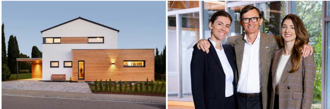
Seit vier Generationen steht die Familie Lux für modernen Holzbau.

Sie wollen Fakten statt Gefühl? Kein Problem!