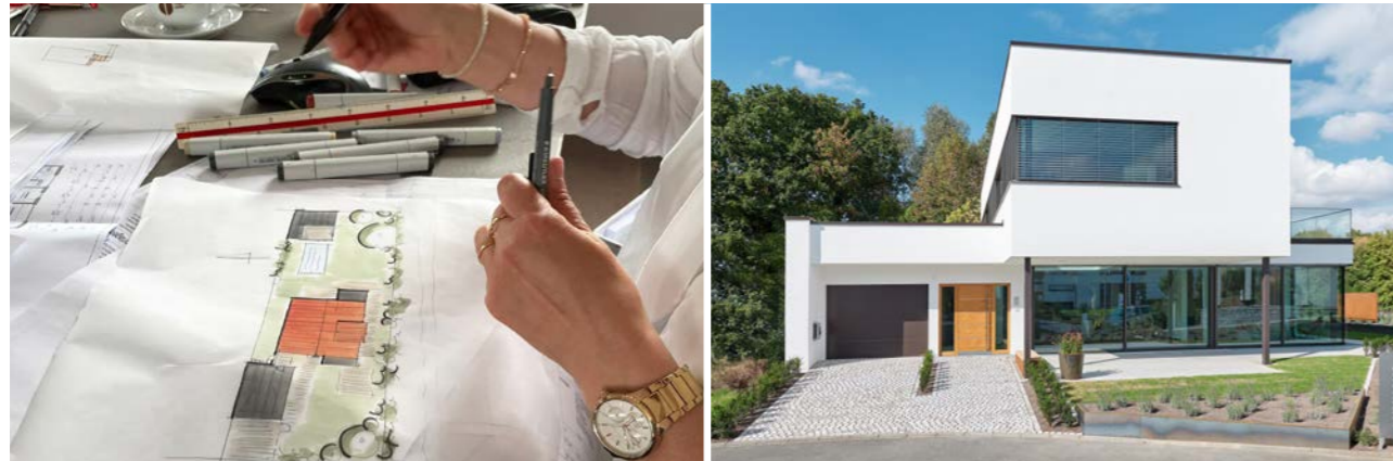
LUXHAUS eigene Architekten planen Ihr individuelles Lieblingshaus

Stellen Sie sich Ihr individuelles Servicepaket zusammen!