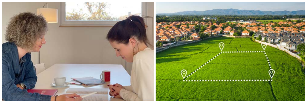
Kompetente Beratung mit umfassender Bedarfsanalyse als Basis für Ihr LUXHAUS