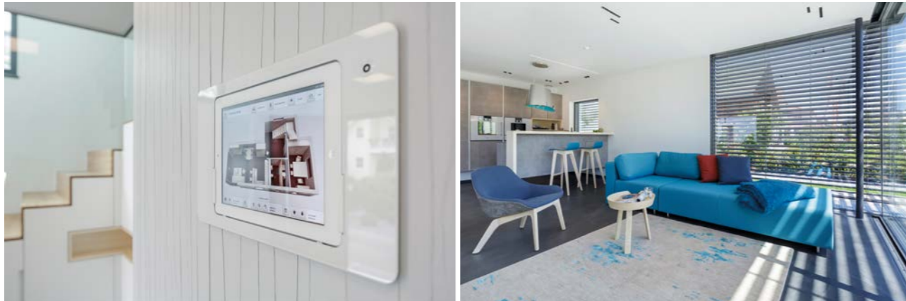
Smart Home System für mehr Komfort und Effizienz, z.B. automatische Verschattung

Doch was bedeutet das konkret für Sie als LUXHAUS Bauherren?