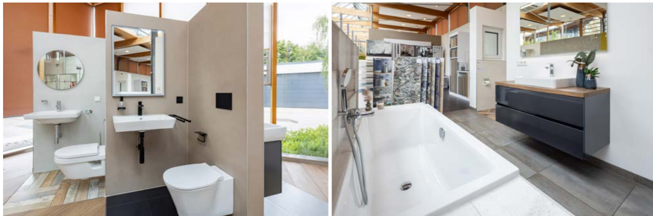
Hochwertige Sanitärobjekte für zeitlose Gestaltung