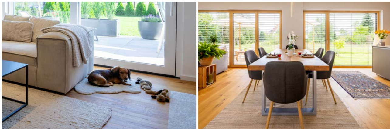
Geprüfte Qualität und Wohngesundheit durch Fachinstitute