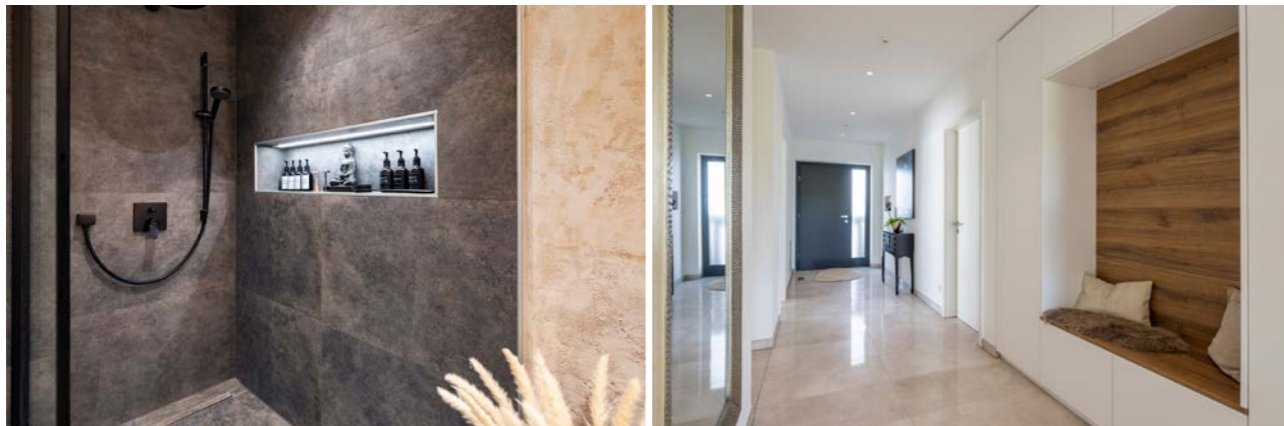
Installationsebene in Wand und Decke, beispielsweise für Einbauten