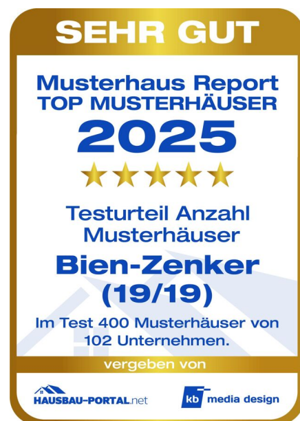
Musterhaus Report 2025