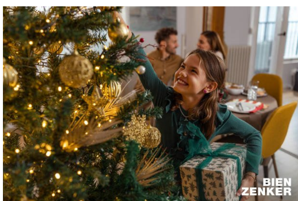
Freude u. Lichterglanz