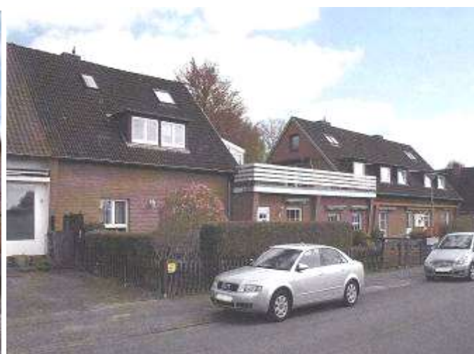
Hausnummer 22 a