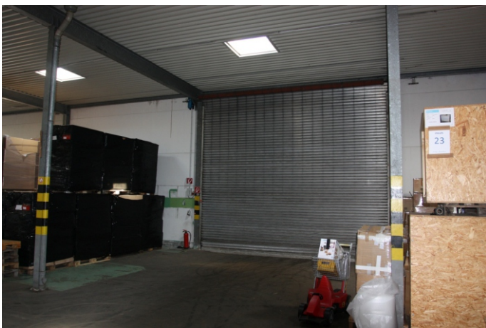
Annahme- und Verladetor 1