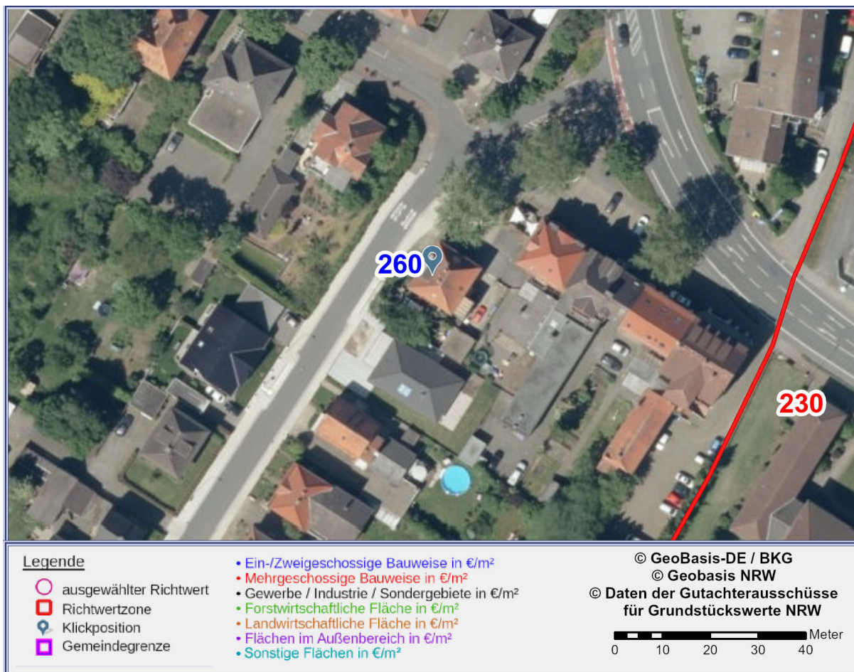
Abbildung 2: Detailkarte gemäß gewählter Ansicht