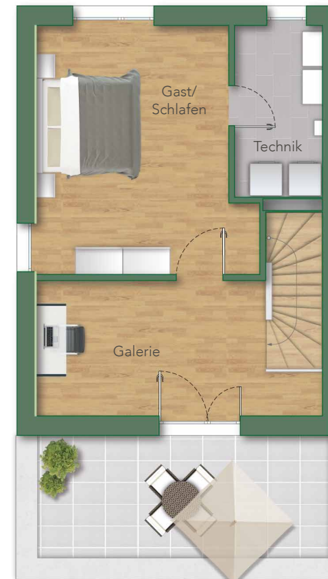
— DG —

Wohnfläche: Konstruktionsbedingte Änderungen vorbehalten