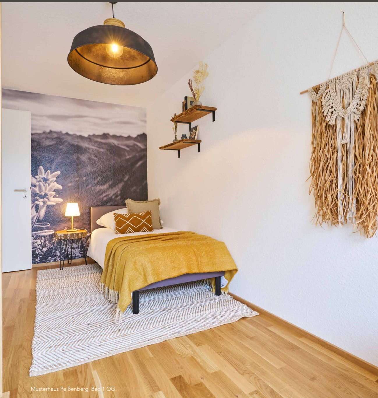
Musterhaus Peißenberg, Bad 1 OG