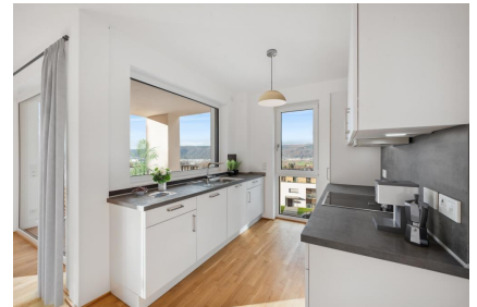
Küche - Muster

Durch den funktionierenden Nahverkehr wird eine gute Anbindung an umliegende Städte geboten. So sind Sie in ca. 15 min. in der Innenstadt. Die Autobahnanschlüsse zur A602, A64 sowie A1 befinden sich in der Nähe.