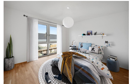
Schlafzimmer - Muster

Die Tiefgarage bietet eine ausreichende Anzahl an Stellplätzen. Hier kann optional ein Stellplatz für monatlich 100,00 € angemietet werden. Auch Außenstellplätze sind ausreichend vorhanden. Ein Außenstellplatz kann für monatlich 60,00 € angemietet werden.