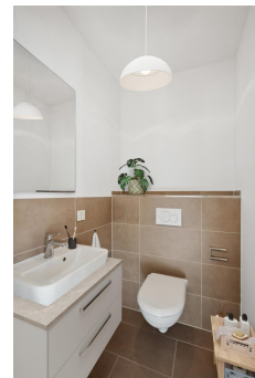
Badezimmer - Muster