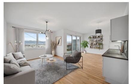
Wohnbereich mit Küche - Muster