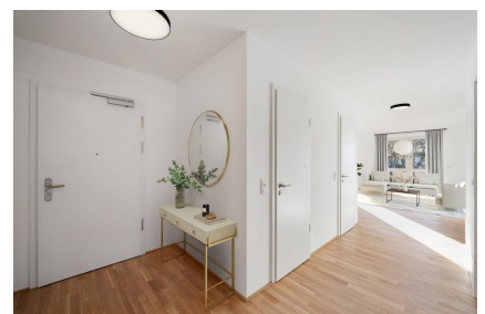
Eingangsbereich - Muster