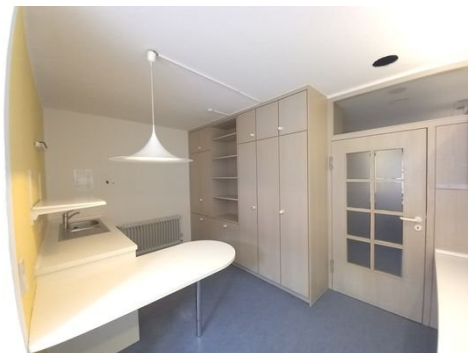
Zimmer 7 mit Küche