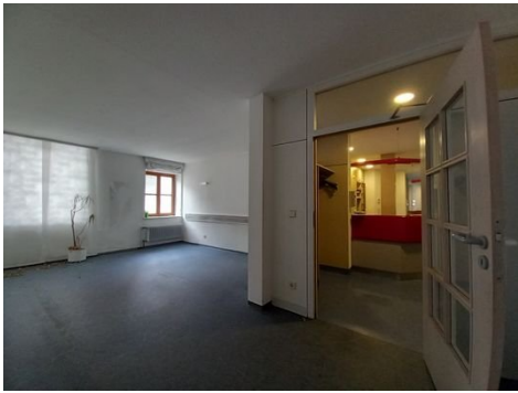
Zimmer 8 mit Blick in den Eingangsbereich