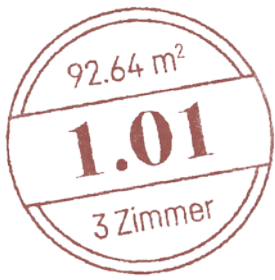
Haupthaus · Hochparterre