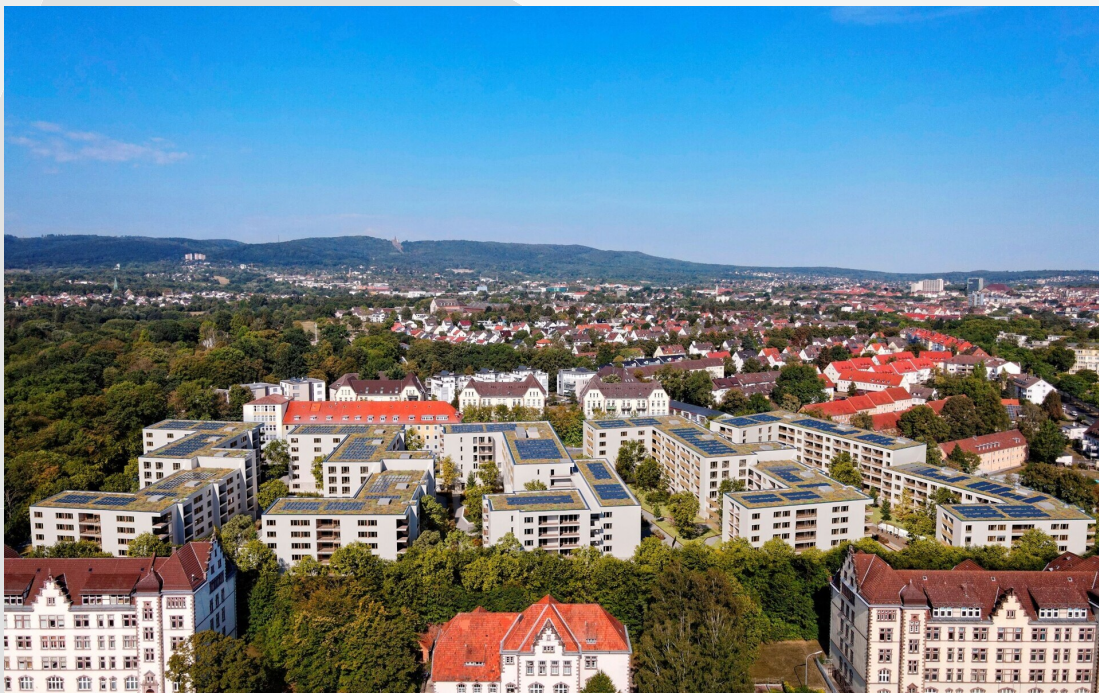
Visualisierung von oben