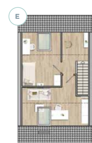
(E) weiterer Raum durch Trennwand

Grundriss-Varianten optional als Sonderwunsch erhältlich.