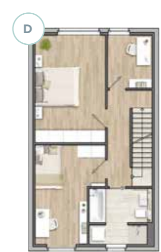
(D) weiterer Raum durch Trennwand