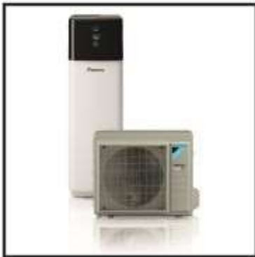
Wärmepumpe Daikin Altherma 3 R