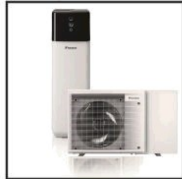
Wärmepumpe Daikin Monoblock