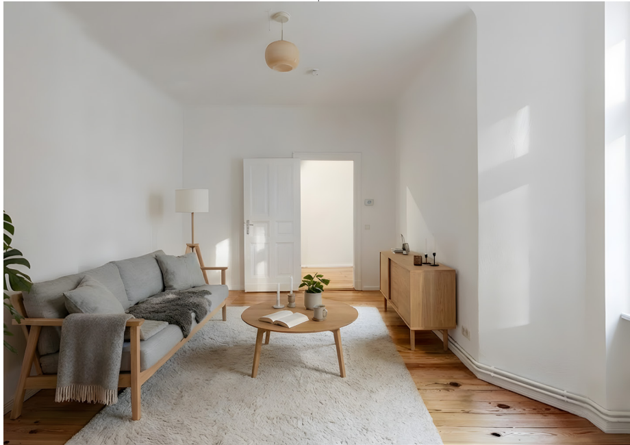
Unverbindliches Wohnungsbeispiel | Non-binding flat example