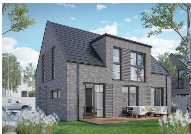
Abbildungen veranschaulichen beispielhafte Häuser.