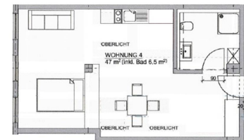
Grundriss 1.OG whg4