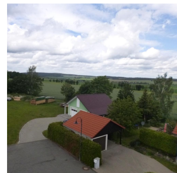
Blick aus dem Fenster