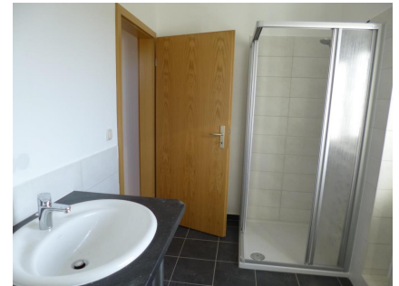
neu saniertes Tageslichtbad - Dusche

Um auch in Zukunft auf dem aktuellen Stand der Technik zu sein, wurden Modernisierungsmaßnahmen durchgeführt. So wurde z.B. eine Fassadendämmung aufgebracht, um Ihre Heizkosten so gering, wie möglich zu halten. Der Eingangsbereich /-treppe wird neu gestaltet.