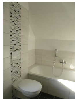
im aktuellen Design saniertes Tageslichtbad