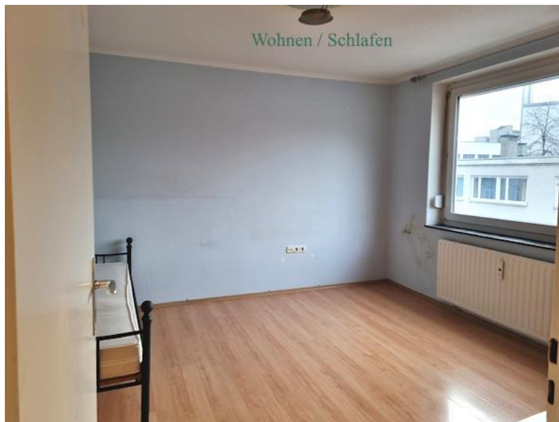
Wohnen / Schlafen