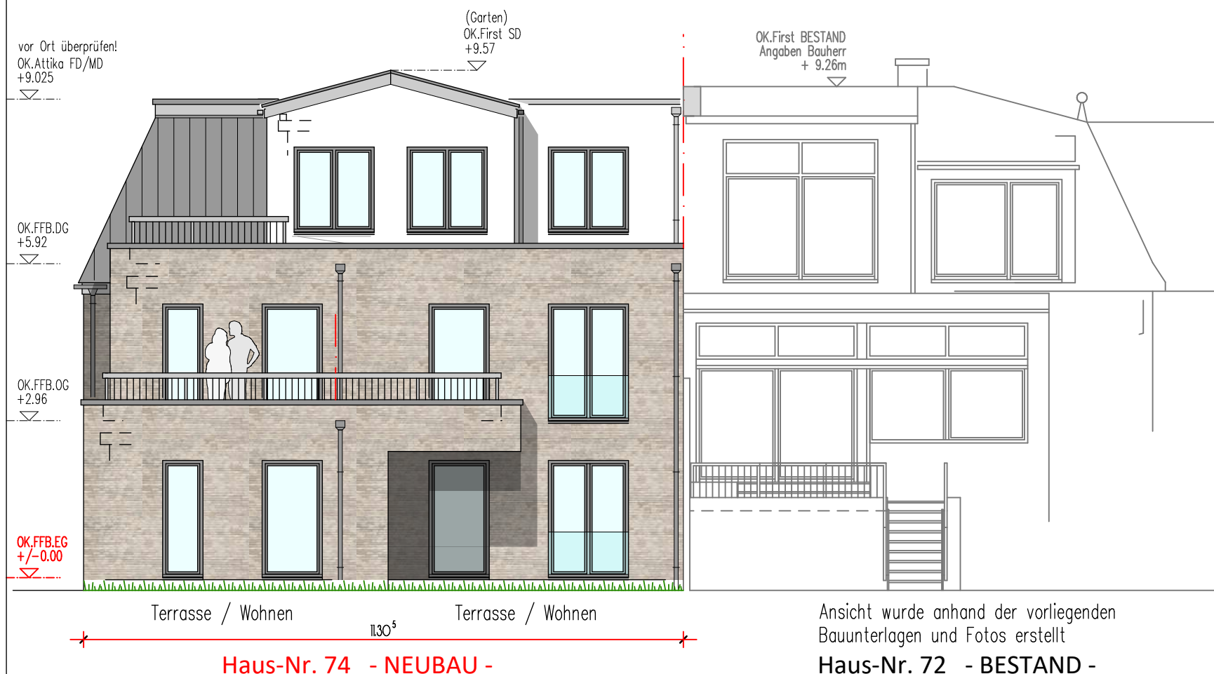
Ansicht: Süd-West | Gartenseite