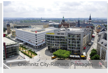
Chemnitz City-Rathaus Passagen