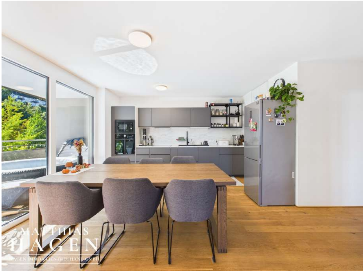
Wohnbereich mit Küche