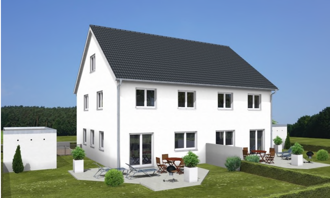
Das Bild enthält Sonderwünsche