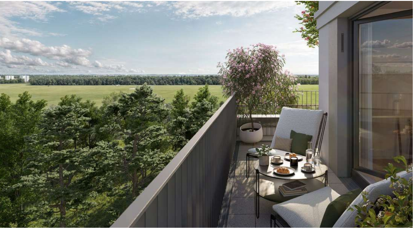
Aus Sicht des Illustrators