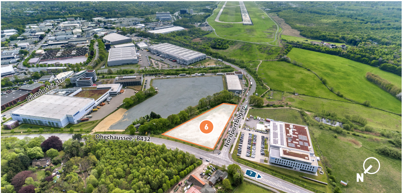
Blick auf die noch verfügbare Fläche im Norden des NORDPORT (B245)