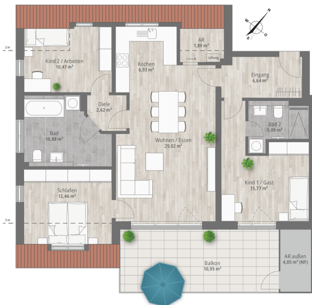
Lage der Wohnung im Geschoss: