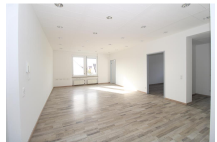
Gemeinschaftsfläche / Empfang / etc