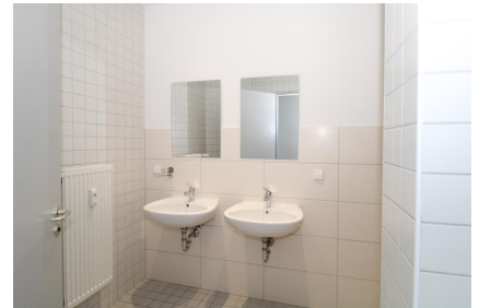
Nassbereich mit Dusche

Kontaktieren Sie uns für einen Besichtigungstermin, wir freuen uns auf Sie.