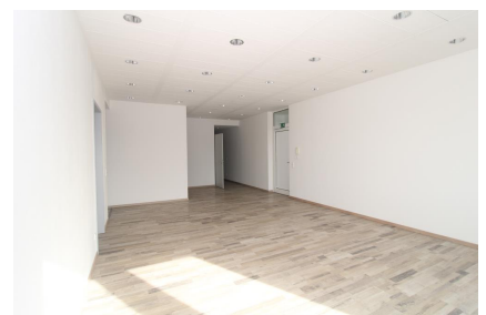
Eingangsbereich / Gemeinschaftsfläche