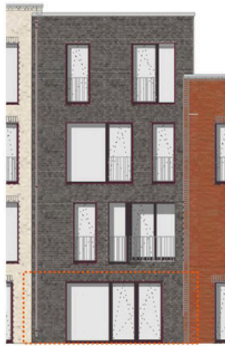
Ansicht Nord M 1:200