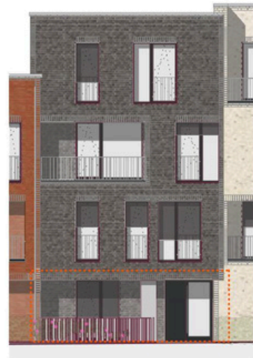
Ansicht Süd M 1:200