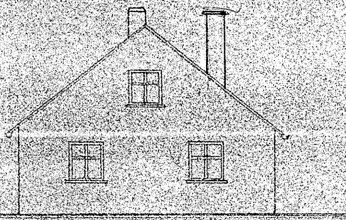
SÜD- u. NORDGIEBEL

Die im Plan eingetrag. Prov.-Einnarungen und baulegende Merkblätter sind bei Ausführung zu beachten.