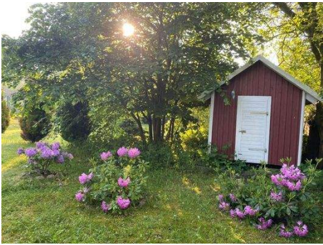
Gedämmtes Vorrats- oder Hühnerhaus