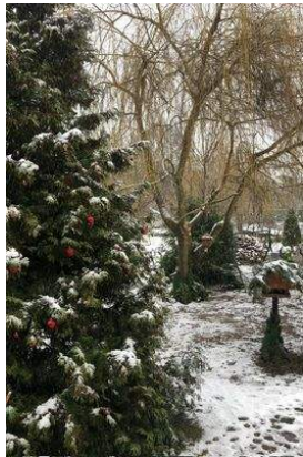
Blick aus dem Wohnzimmer Wohnung 1