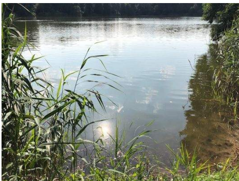
Bade- und Angelsee Groß Pankow