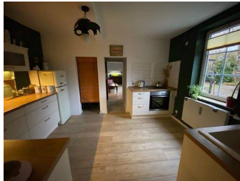
Küche Wohnung 1