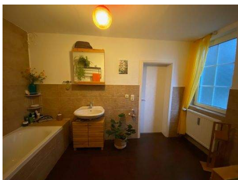
Bad mit Badewanne und WC Wohnung 1