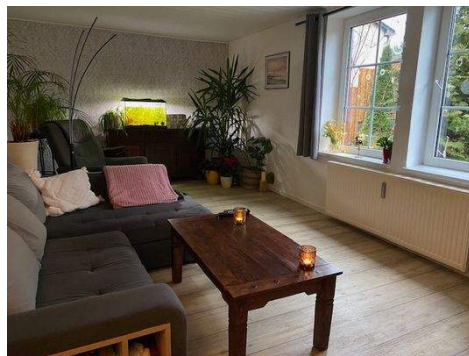
Wohnzimmer Wohnung 1