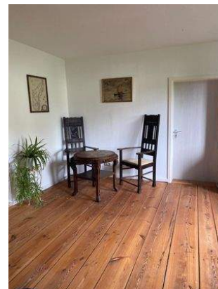
Wohnzimmer Wohnung 2