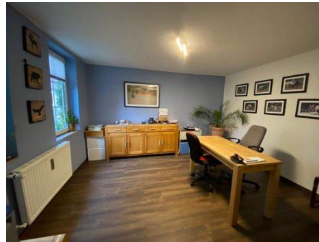
Büro Wohnung 1