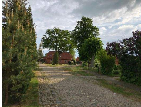
Blick ins Dorf