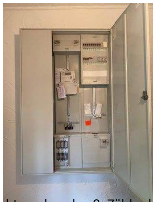
Elektroschrank – 2. Zähler kann installiert werden