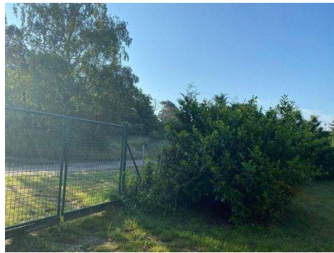
Hinteres Gartentor / Einfahrt