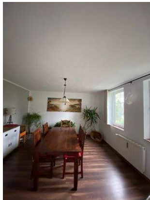
Esszimmer Wohnung 2