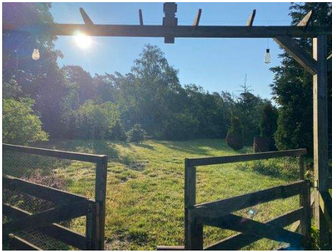
Durchgang vom Garten zum hinteren Grundstücksteil