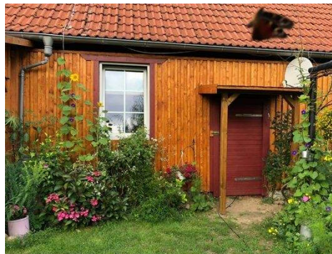
Rückseite des Hauses zum Garten