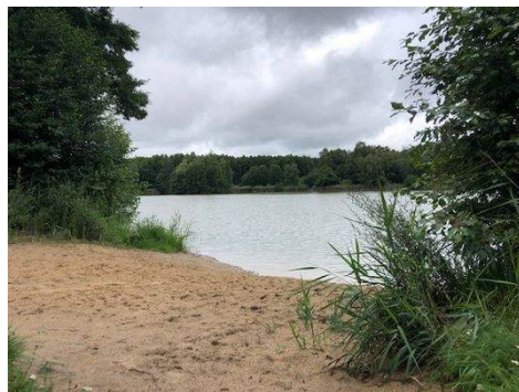
Bade- und Angelsee Groß Pankow