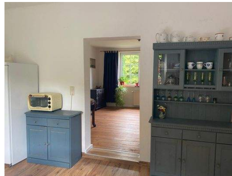
Küche Wohnung 2