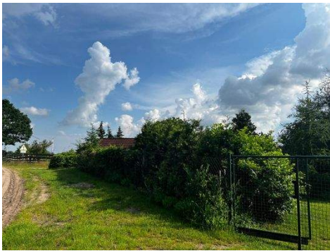
Grundstücksausgang zum Wald