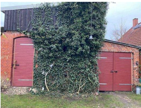
Schuppen und Garage