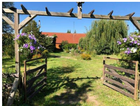
Blick vom hinteren Grundstücksteil in den Garten