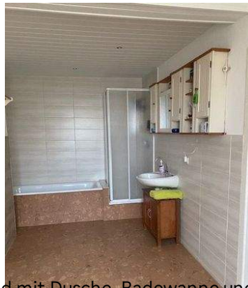
Bad mit Dusche, Badewanne und WC Wohnung 2