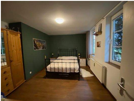
Schlafzimmer Wohnung 1