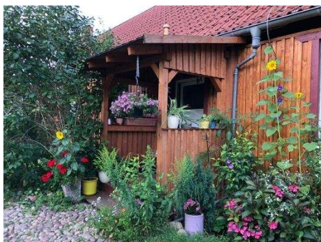
Hauseingang vom Garten