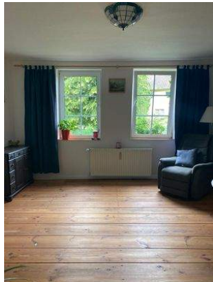
Wohnzimmer Wohnung 2