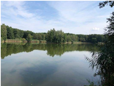
Bade- und Angelsee Groß Pankow