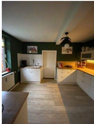
Küche Wohnung 1