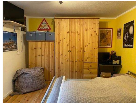
Schlafzimmer Wohnung 2