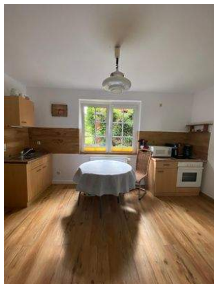
Küche Wohnung 2