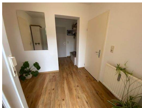
Eingangsbereich Wohnung 1