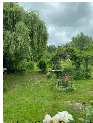
Blick aus dem Küchenfenster Wohnung 1