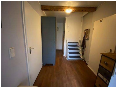
Flur zum Garten zw. d. Wohnungen, Treppe zum Boden