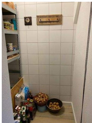
Vorratsraum Wohnung 1