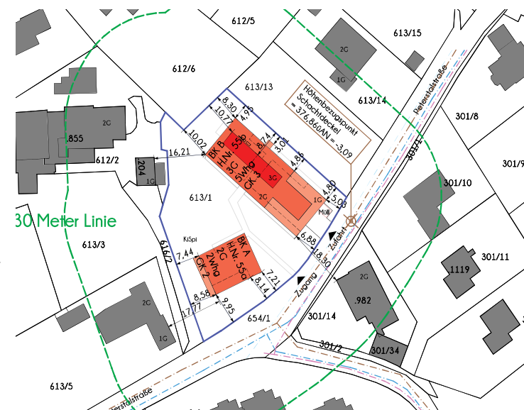
LAGEPLAN | 1_2000

Änderungen & Abweichung gegenüber den publizierten Angaben bleiben ausdrücklich vorbehalten. Leistungsumfang gemäß Bau- und Ausstattungsbeschreibung. Bauliche Änderungen vorbehalten. Statische, konstruktive, haustechnische und bauphysikalische Details sind nicht Planinhalt. Dargestellte Möbel und Einrichtungsgegenstände sowie Bepflanzungen haben symbolhaften Charakter. Raum- und Wohnungsgrößen können sich im Rahmen der Detailplanung ändern. Maß- und Flächentoleranz \pm 3\% .