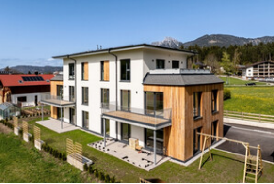
Außenansicht Haus A