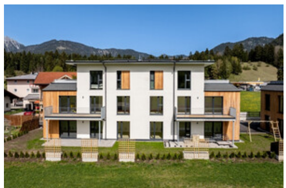
Außenansicht Haus A