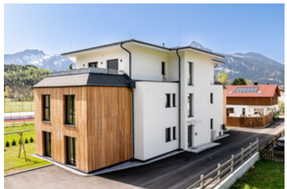
Außenansicht Haus A