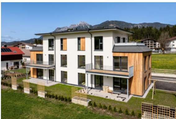
Außenansicht Haus A