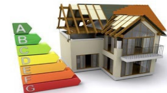
Bau- und Leistungsbeschreibung