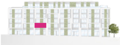
Haus A – Ansicht Süd