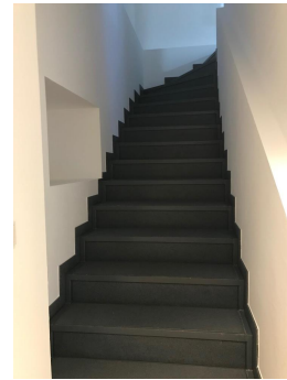
Treppe 3. ins 4.OG