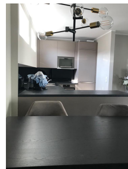
Küche und Essbereich 4.OG