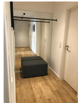
Flur, Eingangsbereich 3.OG